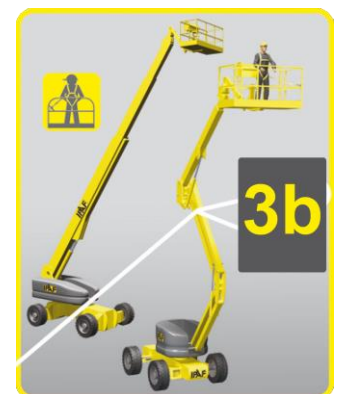
3b: Gelenk- und Teleskopbühnen