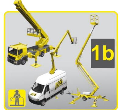
1b: Anhänger-, Raupen-, LKW-Arbeitsbühnen