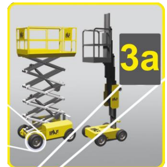
3a: Scheren- und Mastbühnen